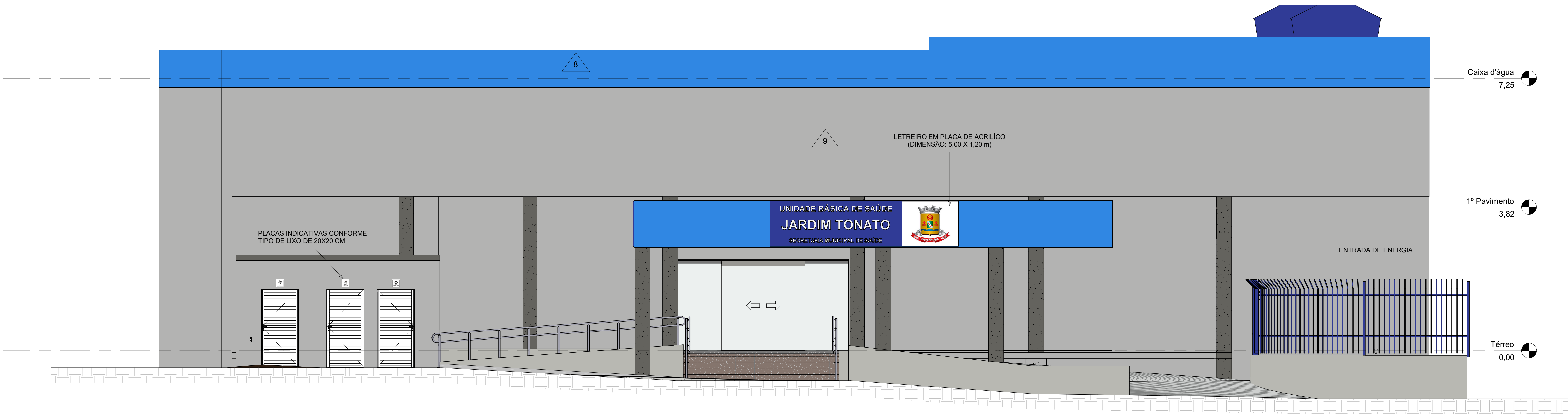
2 FACHADA LATERAL